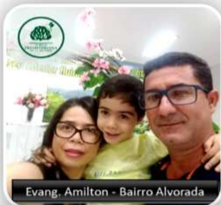
Evang. Amilton - Bairro Alvorada