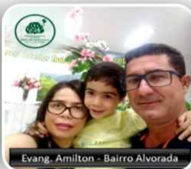
Evang. Amilton - Bairro Alvorada